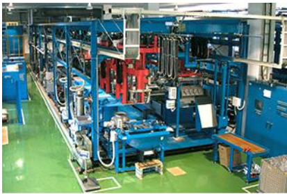
キャリア式クロメート処理装置