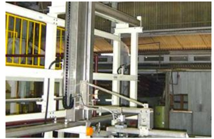
片持ちキャリア式めっき装置