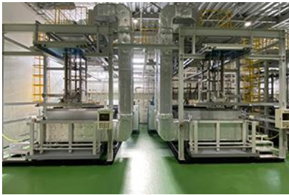
天井走行キャリア式ラックめっき装置