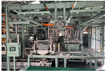
天井走行キャリア式バレルめっき装置